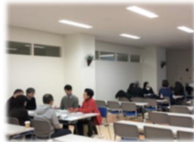
第1回開催時の意見交換風景

【出典】「障害福祉サービス事業所におけるリハビリテーション専門職の支援ニーズ—新潟県における実態調査から—」北上ら（2018）